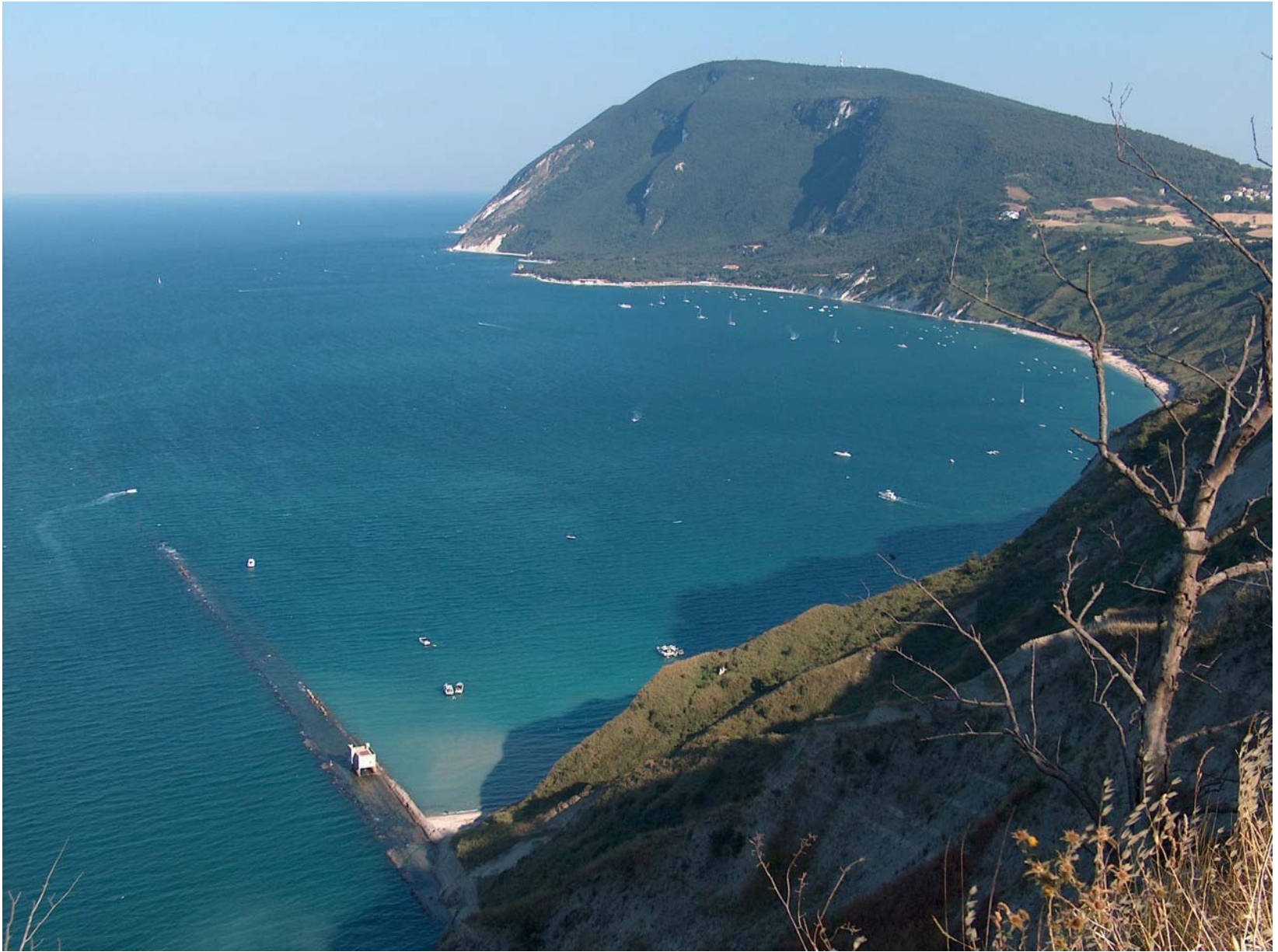
13.03. Panorama verso il Conero. In primo piano l'Orizzonte del Trave. Sulla rupe si colgono le tracce dello scomparso sentiero omonimo.