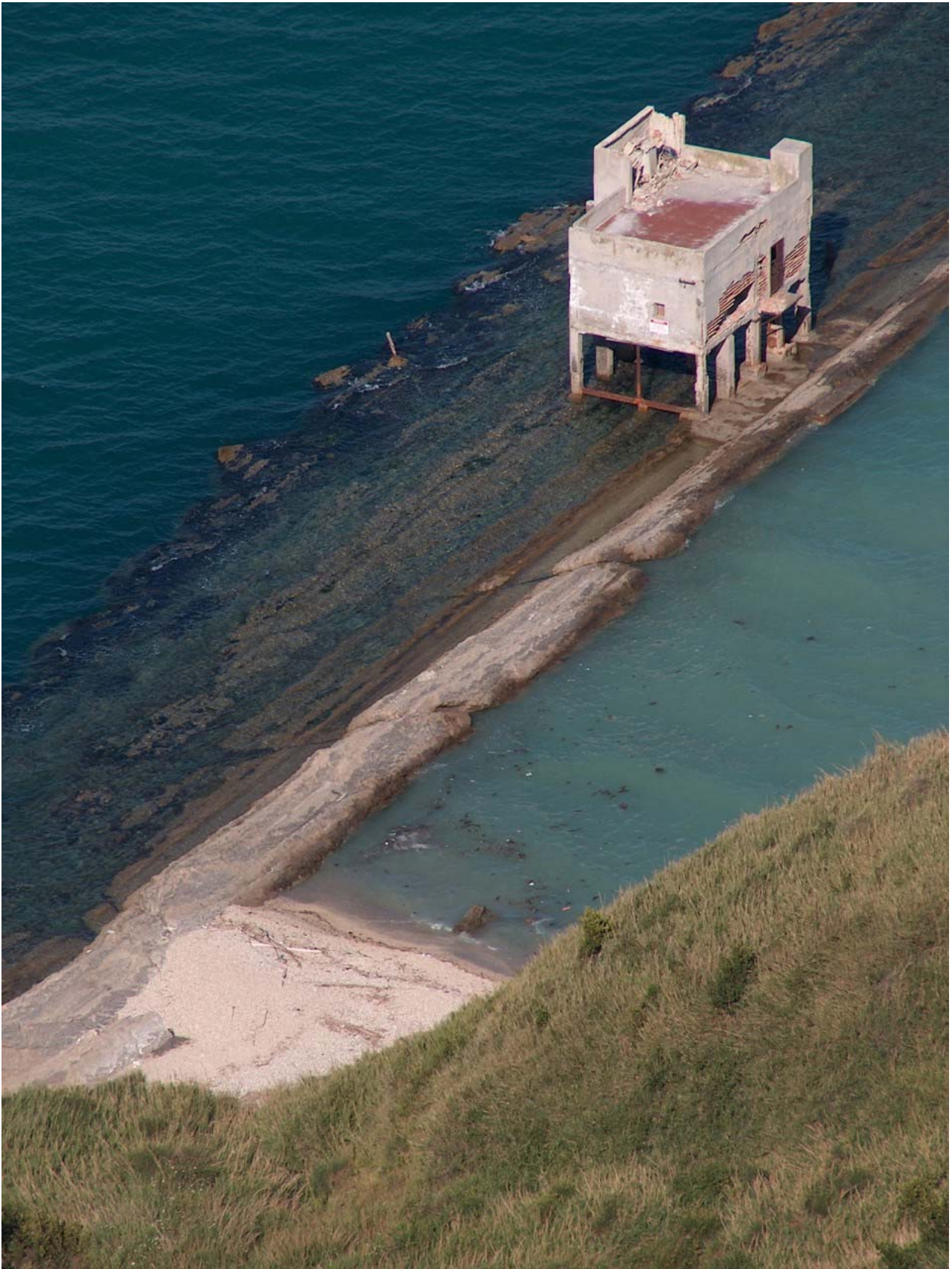
14.03. Particolare della palafitta e del punto dove si concludeva il sentiero.