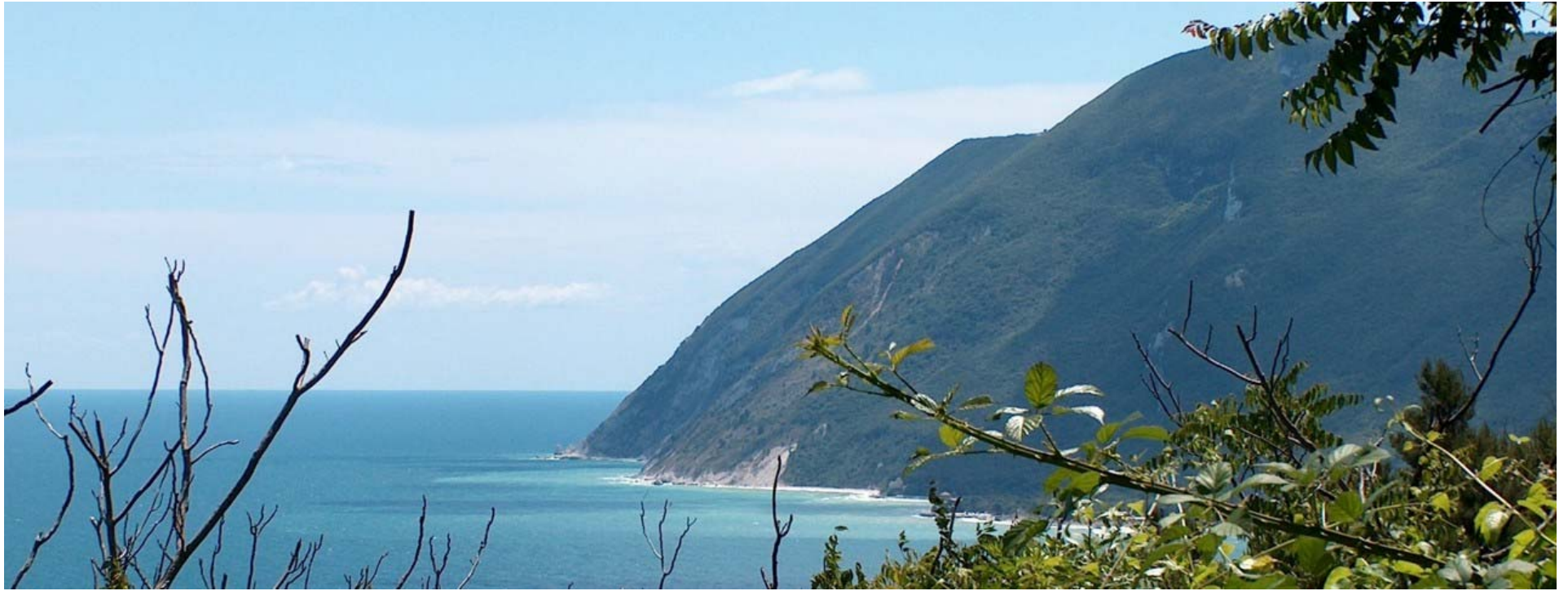
10.06. Scorcio verso il Conero. Si distinguono la Chiesa di S. Maria di Portonovo, la Vela e le Due Sorelle.