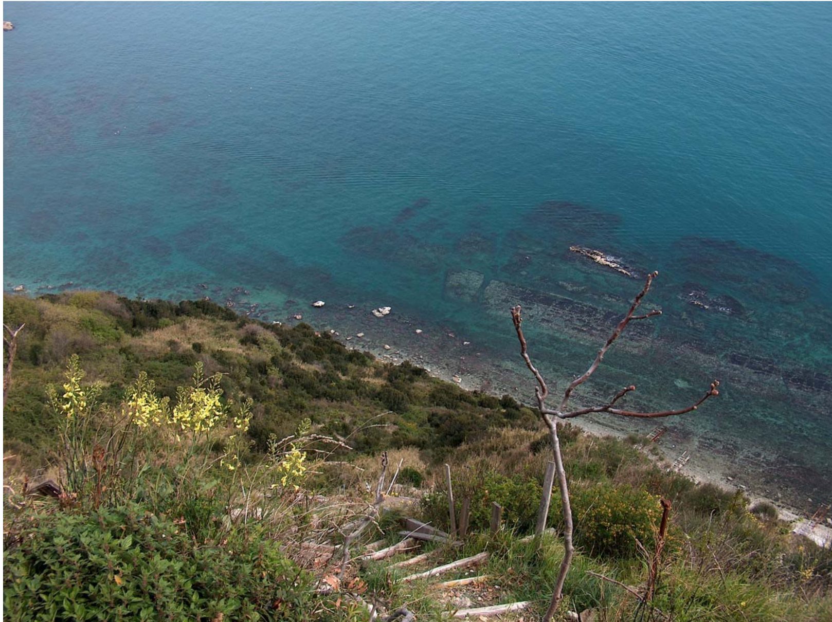
10.02. I ripidi tornanti che scendono verso la spiaggia, tra le fioriture di cavolo marittimo. Spuntano le strutture delle grotte.