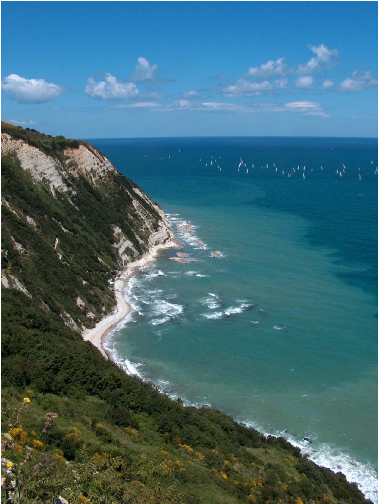
10.01. Monte Carlin nella veste primaverile; la spiaggia della Vena e i Dragheti.