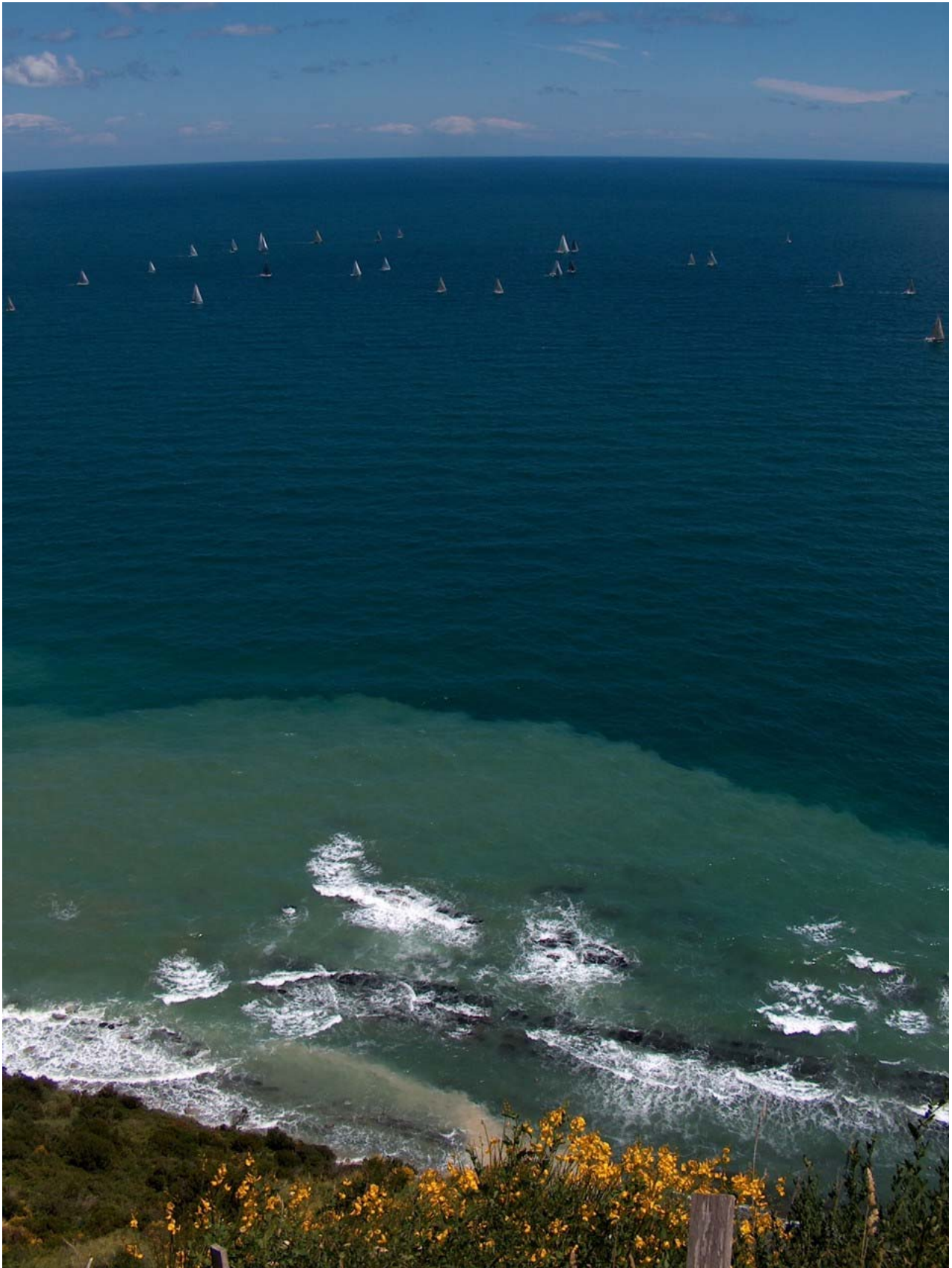
10.04. La rupe e il mare aperto in una ventosa mattina primaverile.