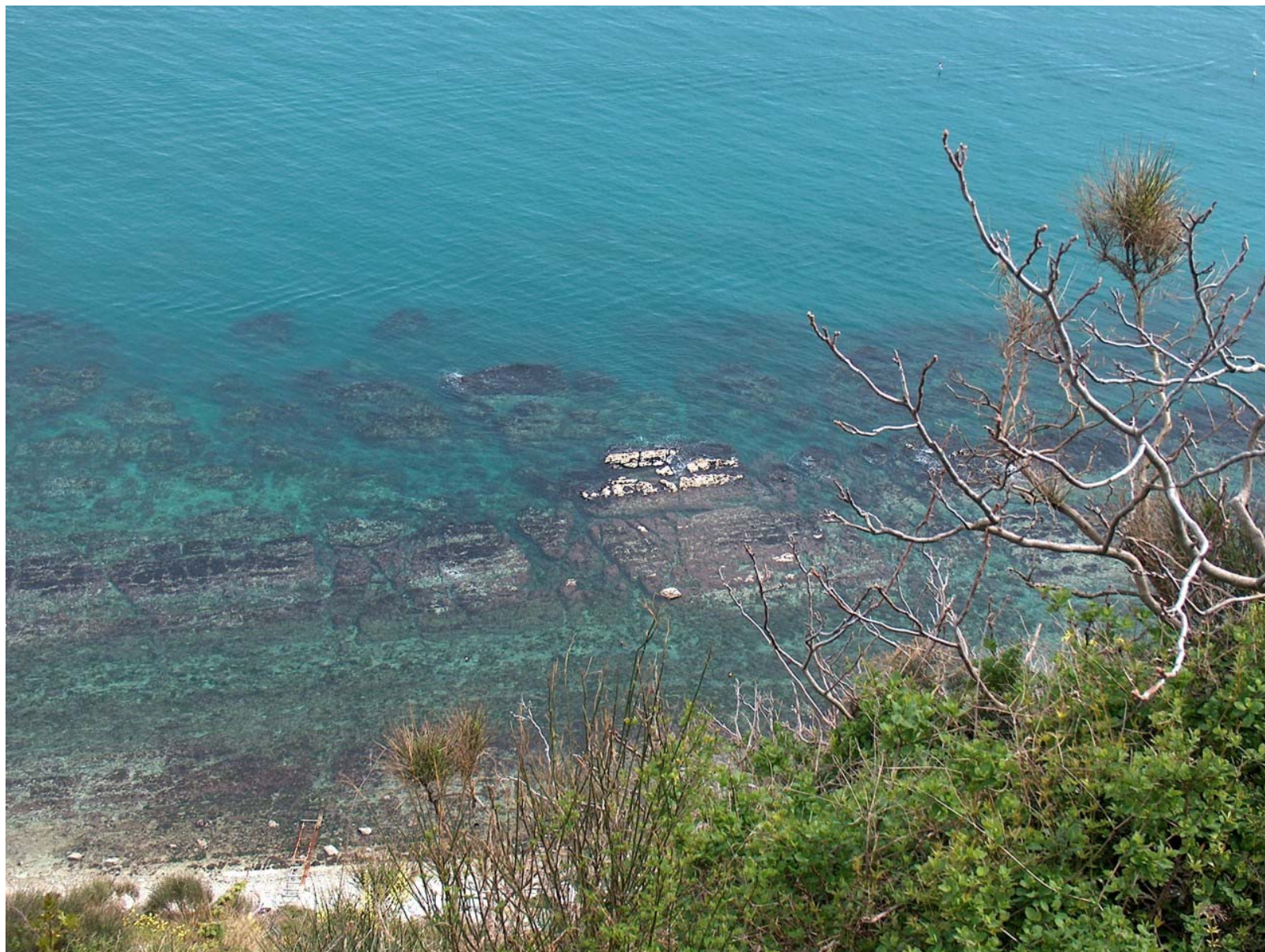
10.05. Fondale di fronte al termine del percorso.